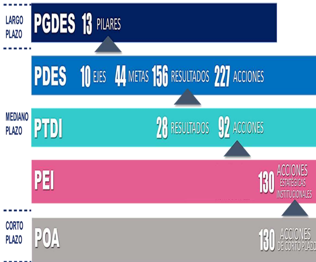
Figura N° 1 Relación entre la Planificación de Largo, Mediano y Corto Plazo

La relación de coherencia entre el Plan de Desarrollo Económico y Social, el Plan Territorial de Desarrollo Integral para Vivir Bien del Municipio de La Paz (PTDI) 2021-2025, el Plan Estratégico Institucional (PEI) 2021-2025 y el Plan Operativo Anual (POA) para la gestión 2024, se presenta a continuación: