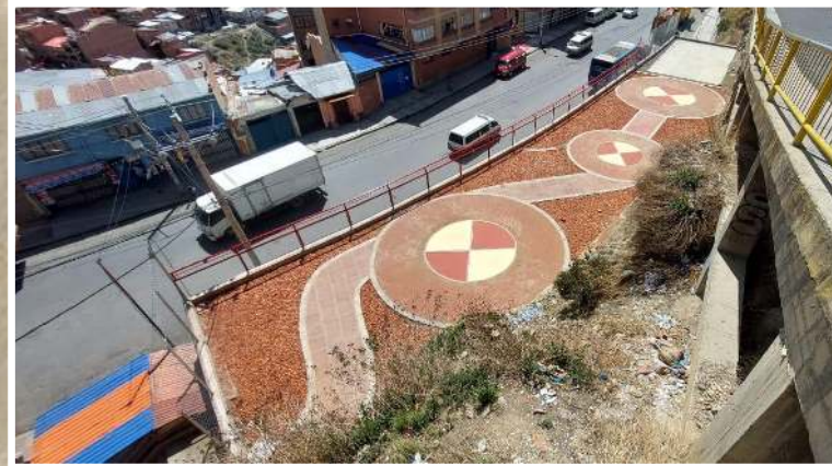
Construcción de aceras, enmallados, y áreas recreacionales