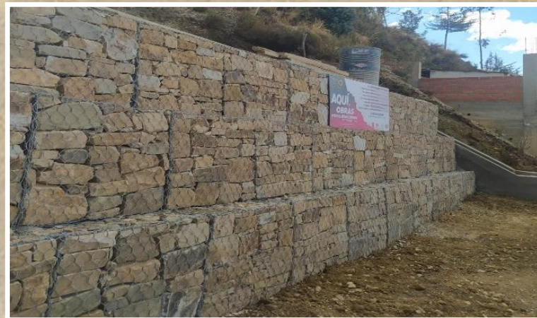
Reducción de riesgos