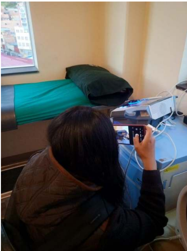
Verificación de Mobiliarios