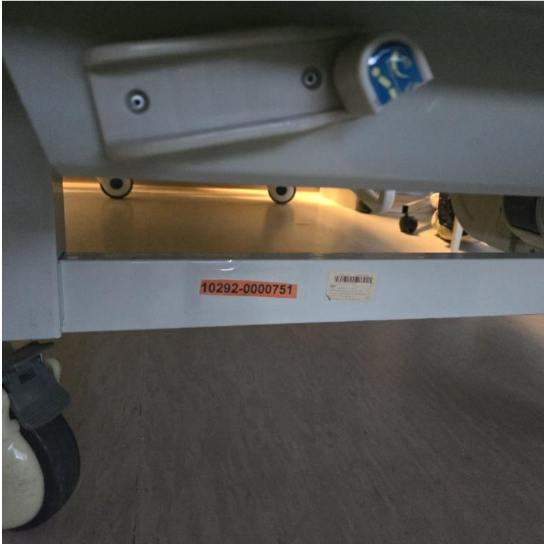
Codificación de Equipos Tecnológicos 1