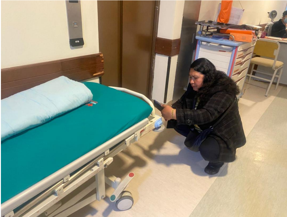
Verificación de Equipos Biomédicos