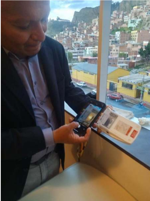
Codificación de Equipos Biomédicos 1