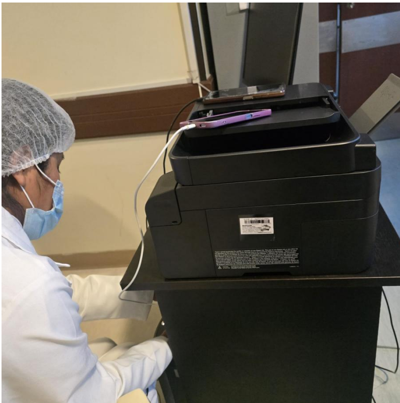
Codificación de Equipos Biomédicos 1